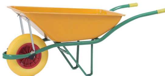
Modelo C900 | Rueda impinchable